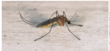
Mug ( Culex sp.)

Waar je ook bent, deze insecten vind je overal. In de tropen brengen ze vaak gevaarlijke ziektes over, zoals slaapziekte en malaria. De soorten die bij ons voorkomen, zorgen alleen maar voor slapeloze nachten en jeuk.